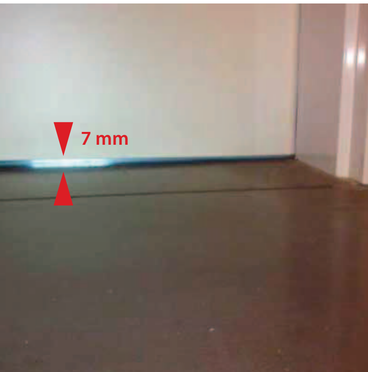
STANDAARD zonder meerprijs